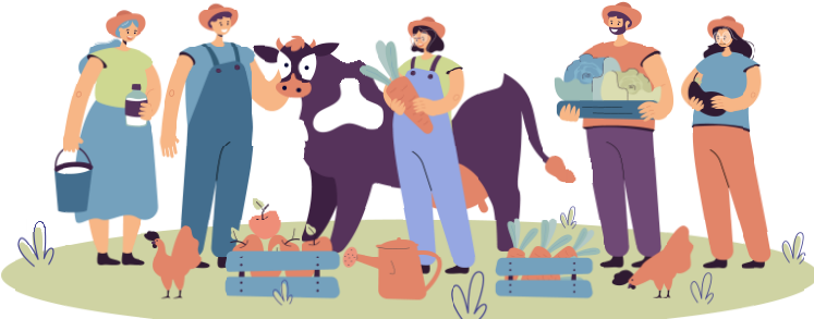
กลุ่มวิจัยและพัฒนา สำนักแผนงานและโครงการพิเศษ

อย่างไรก็ตาม วิกฤตครั้งนี้มาพร้อมกับ โอกาส ได้แก่ โอกาสที่จะมีแรงงานคุณภาพและอายุน้อย ที่พร้อมทำงาน และน่าจะเป็นกำลังสำคัญในการพัฒนาเศรษฐกิจท้องถิ่นและภาคเกษตรไทย, โอกาสที่มาจากข้อจำกัดบีบบังคับให้เกษตรกรได้เรียนรู้และใช้เทคโนโลยีดิจิทัล ซึ่งสามารถนำมา เพิ่มผลิตภาพและสร้างคุณค่าและการเข้าถึงตลาดให้กับผลผลิตทางการเกษตร, โอกาสที่ทำให้ สถาบันในระดับท้องถิ่นต่างๆ มีบทบาทมากขึ้น, และโอกาสที่ทำให้ทุกคนหันมาพึ่งพิงและพยายาม สร้างระบบเศรษฐกิจท้องถิ่นให้มีความเข้มแข็งจากข้างใน