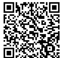
QR Code งานวิจัยฉบับเต็ม